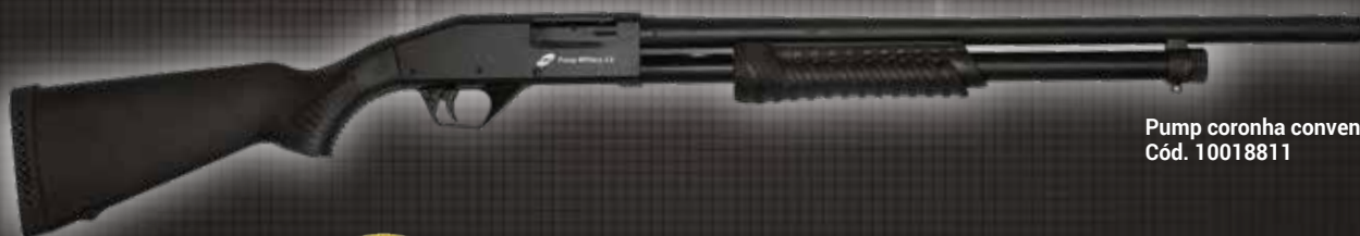
Pump coronha convencional Cód. 10018811

reduz em até 50% o impacto*. *quando comparado com os modelos anteriores.