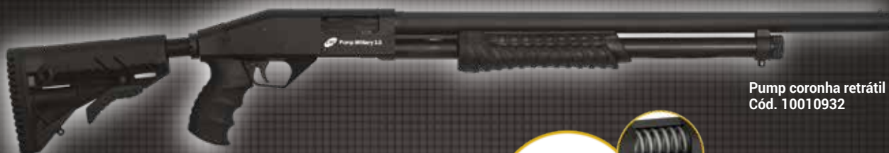
Pump coronha retrátil Cód. 10010932

A Pump Military 3.0 CBC foi a primeira espingarda calibre 12 homologada pelo Exército Brasileiro como MEM – Material de Emprego Militar. Esta importante certificação é composta por vários critérios e etapas de avaliação, abrangendo rigorosos testes de desempenho e de resistência em condições extremas.