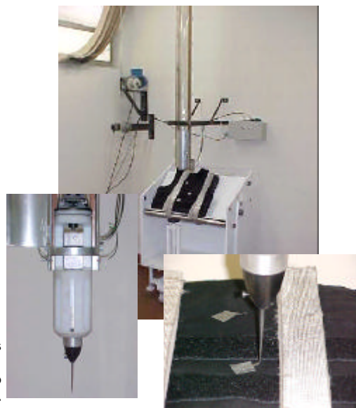
Equipamento para realização dos testes exigidos pela norma NIJ para o Colete Correcional e resultado após queda do Spike no Colete Multi Ameaça CBC.